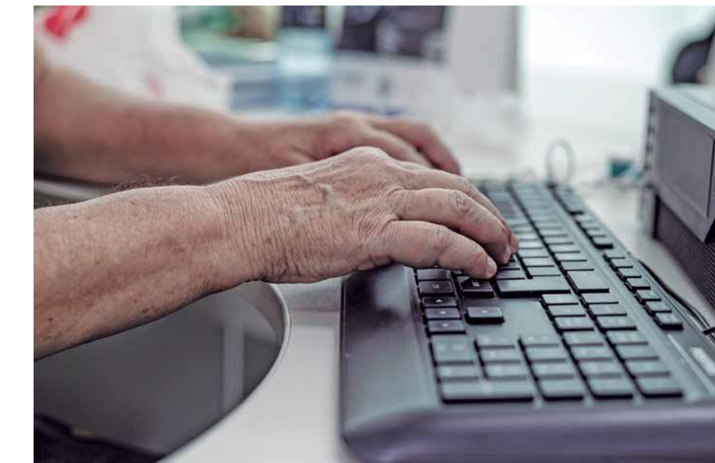
Cursar uma graduação na terceira idade ajuda a promover a autonomia, evitar o isolamento e fortalecer laços comunitários