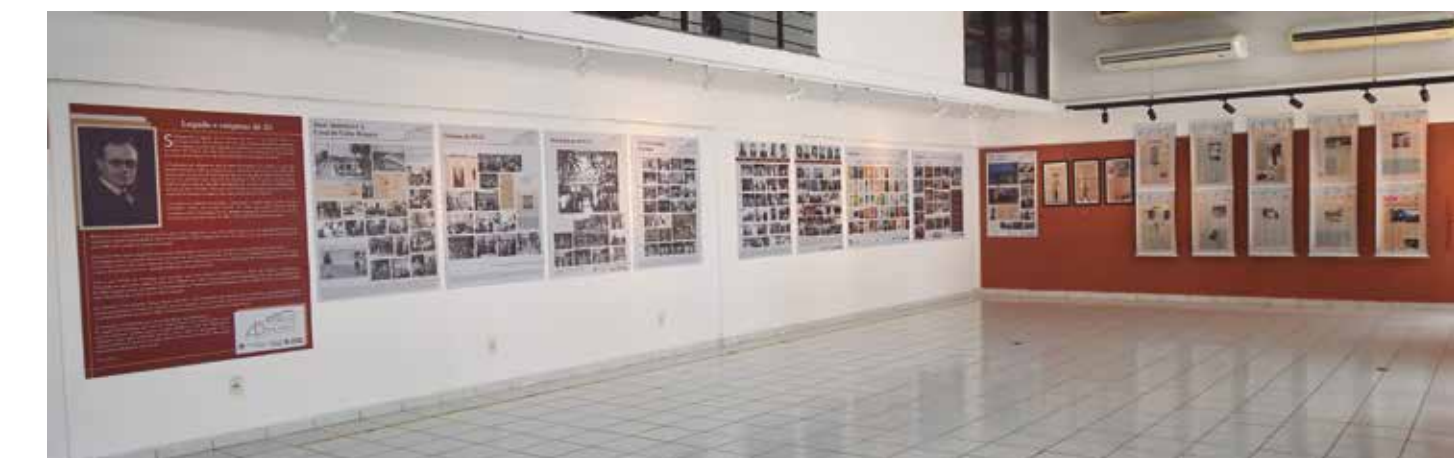
O jornal A Uni o contou a trajet ria da institui o ao longo dos anos e ganhou uma se o com suas p ginas em destaque na mostra

Entre os pain is expostos na Funda o, muitos des-