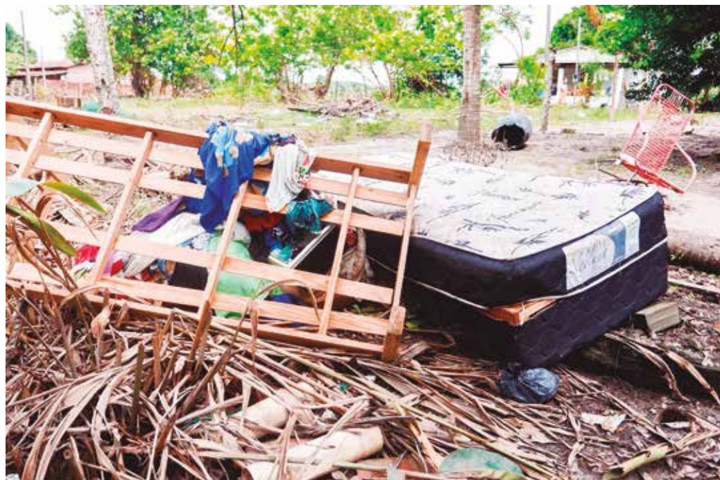
Engenho Velho foi uma das comunidades com perdas de bens materiais após as chuvas