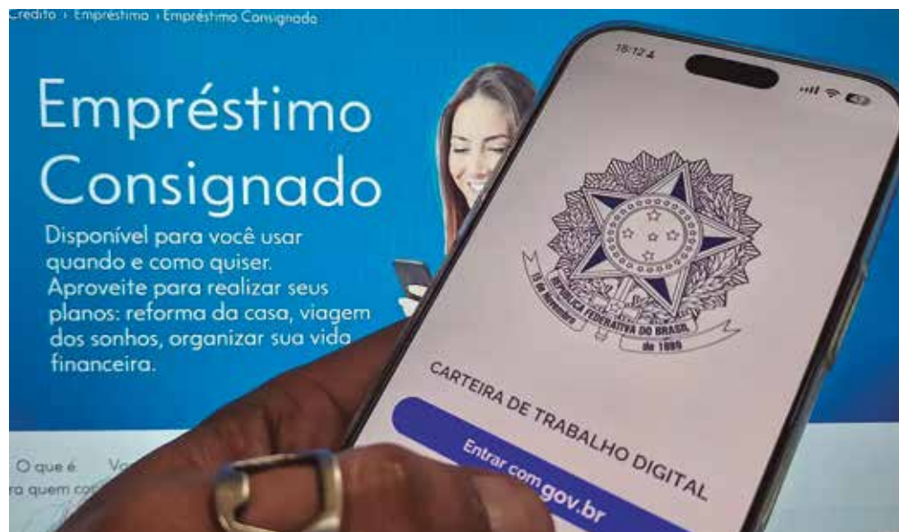
Setor movimentou cerca de R$ 100 bilhões e atende milhões de aposentados e pensionistas

Apesar da liberação parcial, o TCU manteve proibidas as novas concessões nas modalidades: cartão de crédito consignado e cartão consignado de benefício.