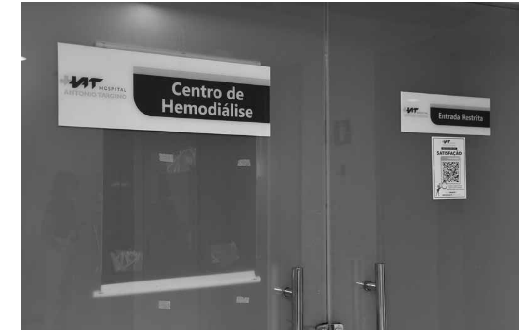
Segundo Secretaria de Saúde de CG, responsabilidade pelos insumos é do próprio hospital

A equipe do jornal A União esteve no Hospital Antônio Targino, mas não conseguiu entrevistar representantes do setor administrativo ou diretivo. Durante a visita, uma enfermeira do Centro de Hemodiálise, que preferiu não se identificar, informou que a suspensão ocorreu devido ao atraso na entrega de insumos indispensáveis para o procedimento. Conforme relatado, por causa do feriado do Dia do Trabalhador, em 1º de maio, o material — enviado de fora da região — não chegou dentro do prazo previsto, ocasionando a paralisação temporária. A profissional afirmou, ainda, que os atendimentos ficaram suspensos apenas durante a manhã da quarta-feira e foram retomados ao meio-dia, logo