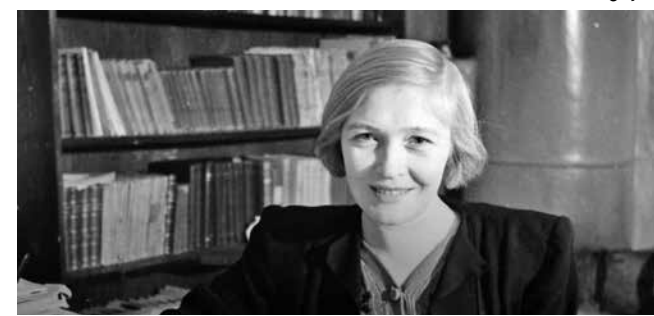
Olga Bérggoltz foi conhecida como “a voz de Leningrado”