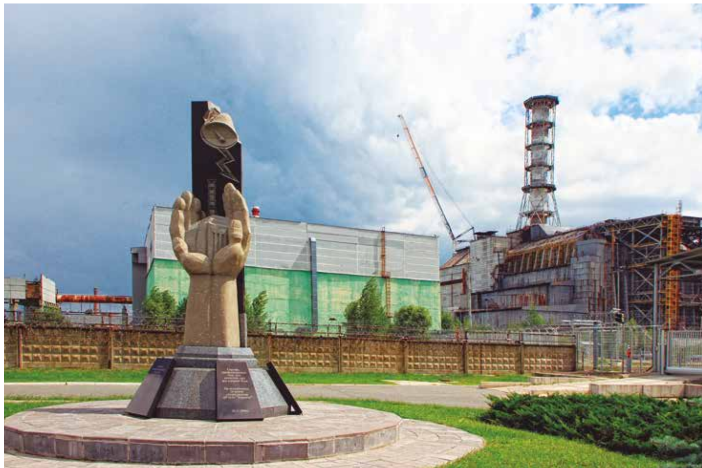
Governo ucraniano pediu à população que preste atenção apenas aos comunicados provenientes de canais e fontes oficiais

Além disso, pediu à população que, “diante de informações contraditórias, prestem atenção apenas aos comunicados provenientes de canais e fontes oficiais