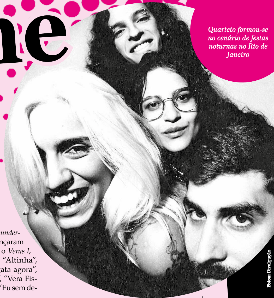
Quarteto formou-se no cenário de festas noturnas no Rio de Janeiro

As letras, segundo ela, tratam das paisagens sonoras estéticas clubber e fazem uma autorreferência às vivências do grupo. “A gente ficou amiga frequentando as festas, indo para festa todo final de semana, fazendo after juntas, ficando muito juntas. Com certeza, é um resumo das nossas experiências, de um retrato geral que foi tirado daqueles anos ali vivendo isso. É um cenário que a gente de fato fez parte, viveu, atravessou no Rio de