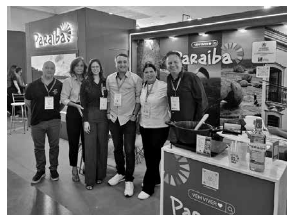
Representantes da PBTur e da Setde estavam presentes