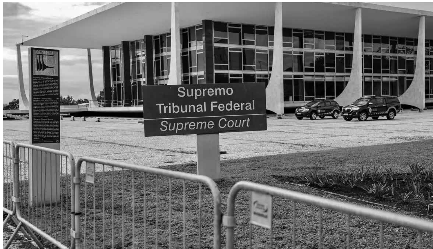
A nova decisão proíbe a reformulação da estrutura de cargos e de unidades funcionais do Judiciário, MPs, entre outros

Dessa forma, juízes, promotores e procuradores poderão ganhar pelo menos R$ 62,5 mil mensais, somando o teto e R$ 16,2 mil em penduricalhos.