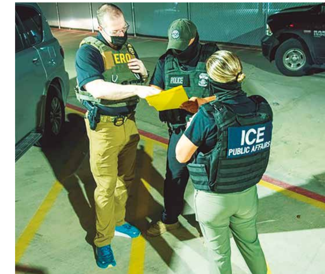
Medida busca evitar o uso excessivo da força praticado por agentes protegidos pelo anonimato

Esse pacote de medidas também proíbe que os agentes utilizem prisões locais para abrigar detidos e realizem buscas em residências, hospitais, igrejas e