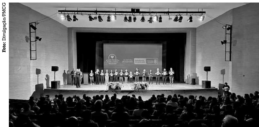
Homens e mulheres receberam as orientações para a data prevista do casório: 12 de junho