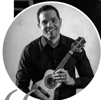
Carreira passa a ser estruturada em cinco classes, definidas conforme a formação acadêmica, com sete níveis de progressão horizontal

Hoje, o músico chega ao ensaio mais tranquilo. O governo trouxe a OSPB para dentro da sua estrutura. Fazemos parte de uma política de Estado