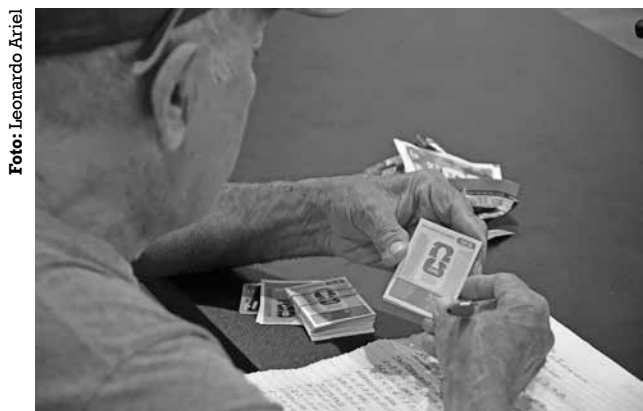
Mercado das estampas tem antigos colecionadores