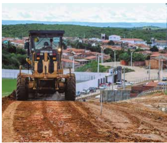
Pavimentação na rodovia PB-370 abrange trecho de 9 km