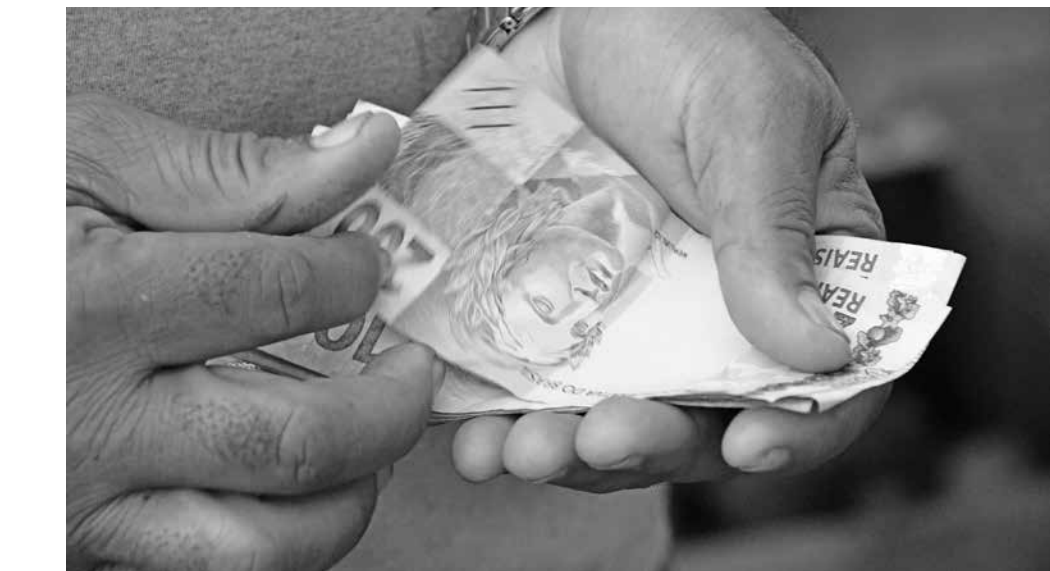
Resultado do estado supera o da Região Nordeste, que registrou rendimento médio de R$ 1.470

Mesmo com o aumento da renda média, o IBGE identificou uma elevação no nível de desigualdade social na Paraíba. O Índice de Gini do estado – indicador utilizado para medir concentração de renda – passou de 0,496 em 2024 para 0,507 em 2025. Quanto mais próximo de 1, maior a de-