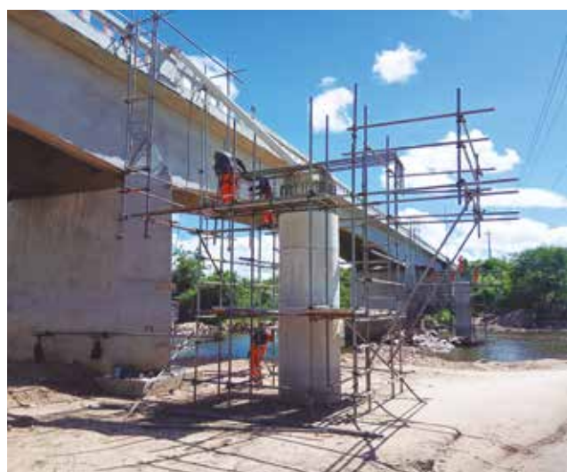
Obra do Dnit conta com R$ 11 milhões em investimentos

Com investimento aproximado de R$ 11 milhões para a plena recuperação da ponte, estão previstas a ampliação da pista, a implantação de ciclofaixas e a construção de passeios para pedestres, promovendo melhores condições de tráfego e acessibilidade. A ação integra o Programa de Manutenção e Reabilitação de Estruturas (Proarte) e contempla a elaboração e execução do projeto de reabilitação da estrutura. Entre as principais intervenções, destaca-se o reforço e o alargamento da plataforma, que passará dos atuais 5,6 m para 13,45 m de largura.