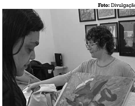
Estudantes mostram suas obras variadas