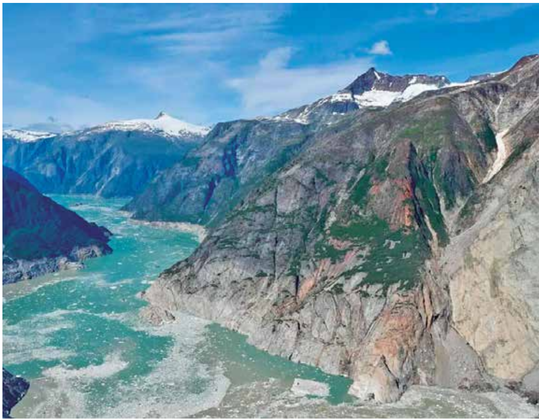
Registro após o deslizamento no Tracy Arm mostra as consequências do fenômeno, em agosto de 2025

Conforme os pesquisadores, tanto o deslizamento de terra quanto o tsunâmi foram registrados por sismógrafos