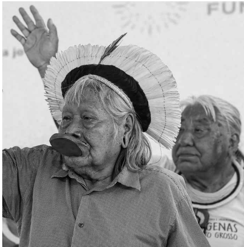
Exames constatarem um quadro de hérnia diafragmática traumática crônica